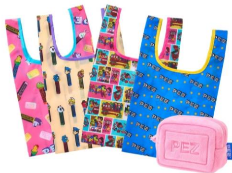
PEZ ポーチ付きシークレットエコバッグ(全4種) 2,200円(税込) https://www.plazastyle.com/shop/g/g4525636355219/