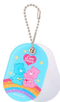
購入者特典 スライドミラーボールチェーン

※ショッピングバッグは無料です。 ※商品の購入点数と同数を上限とさせていただきます。 ※数量限定、なくなり次第終了です。