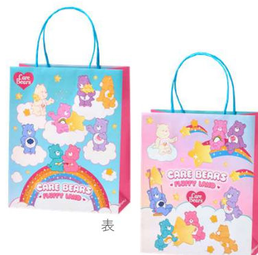
表 裏 ショッピングバッグ