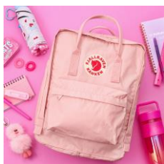
フェールラーベン KANKEN リュック ROSE 16L 14,300円