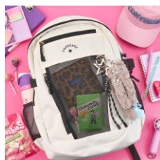
CONVERSE バックパック アイボリー 28L 10,560円