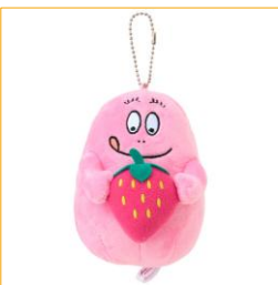
マスコットキーチェーン 1,980円