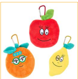
フルーツポーチ(全3種) 各 1,590円