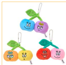
チェリーマスコット(全3種) 各1,690円