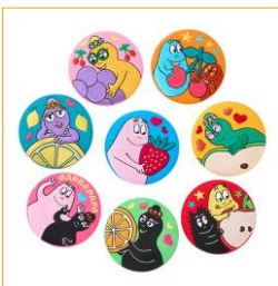
シークレット刺しゅう缶バッジ(全8種) 各880円