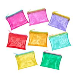
シークレットクリアポーチ (全8種) 各770円