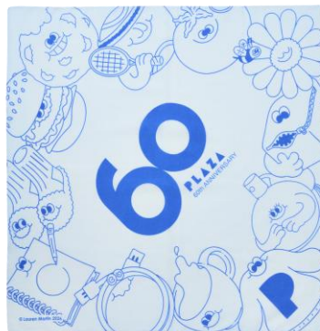
限定ノベルティ バンダナ(非売品)