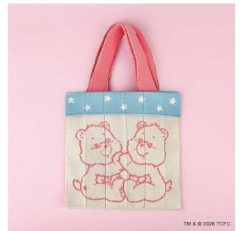
Co-Knitly ケアベア™ 5,500円(税込)