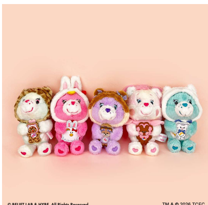
© BELIFT LAB & HYBE. All Rights Reserved. TM & © 2026 TCFC

また、ILLITとのコラボレーションアイテムをご購入いただいた方にポップアップストア限定デザインステッカーをプレゼントします。