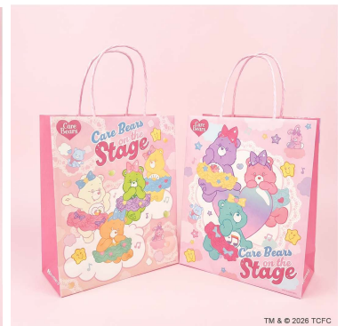
ショッピングバッグ