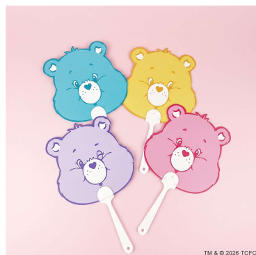
購入者特典 (うちわ)

※ショッピングバッグは無料です。 ※商品の購入点数と同数を上限とさせていただきます。 ※数量限定、なくなり次第終了です。