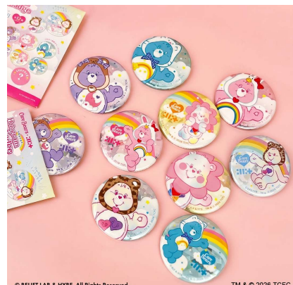
© BELIFT LAB & HYBE. All Rights Reserved. TM & © 2026 TCFC