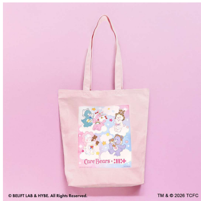
ポップアップストア限定トートバッグ 2,500円(税込)