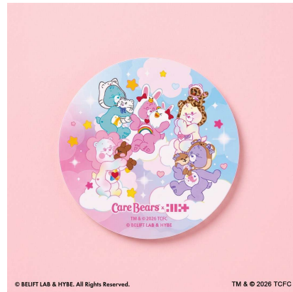
※1会計につき1点プレゼントします。 ※数量限定、なくなり次第終了です。