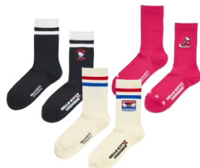
ソックス(ブラック、ホワイト、ピンク) 各990円