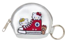
カラピナ付きポーチ 2,970円