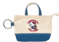
ミニチュアトート 2,750円