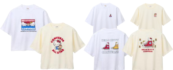
プリントTシャツ(ホワイト、アイボリー) 各5,060円