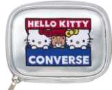
ミラー付きポーチ 3,740円