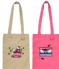
ミニトート(ベージュ、ピンク) 各4,400円