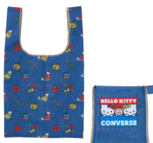
パッカブルエコバッグ 3,300円