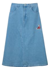
デニムスカート 7,590円