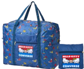
キャリーオンバッグ 4,950円