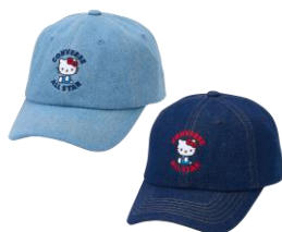
キャップ(ライトブルー、ダークブルー) 各4,730円