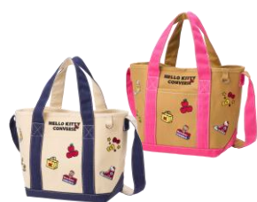
キャンバストート(アイボリー/ネイビー、ベージュ/ピンク) 各7,150円