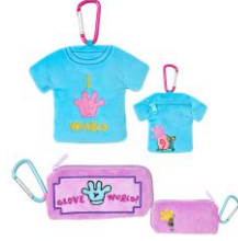
ダイカットポーチ Tシャツ/チ ケット 各1,650円