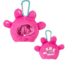
帽子型マスコットキーリング 1,430円