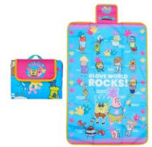
ピクニックマット 2,970円