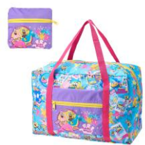
バックブルトート 3,960円