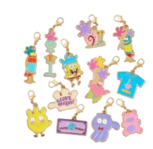
シークレット メタルチャーム 825円