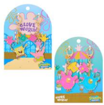
ペアキーリング 2種 各1,650円