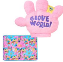
ブランケットインクッション 4,620円