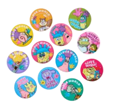
シークレット刺繍缶バッジ 770 円