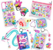
SKINNY DIP モバイルグッズ 各2,420~4,400円