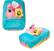
ジェットコースター型 ティッ シュケース 3,520円