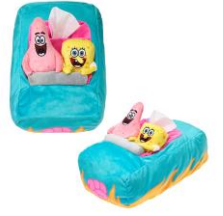
ジェットコースター型 ティッ シュケース 3,520円