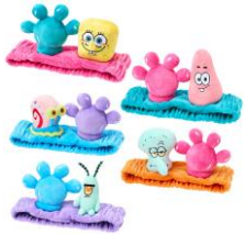
ヘアターバン 5種 各2,750円