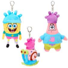
マスコットキーリング スポンジ・ボブ/パトリック 各2,530円、 ゲイリー 1,980円