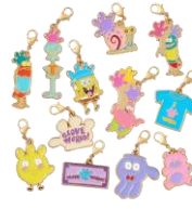
シークレット メタルチャーム 825円