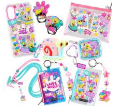
SKINNY DIP モバイルグッズ 各2,420~4,400円