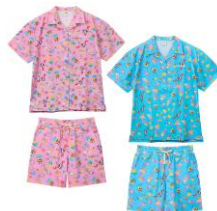
速乾素材 シャツ 2種 各4,950円、 ショートパンツ 2種 各4,290円