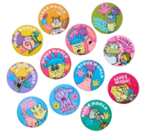
シークレット刺繍缶バッジ 770 円