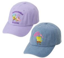
キャップ 2種 各3,960円