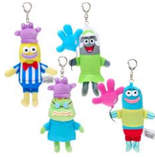
マスコットキーリング 4種 各 2,420円