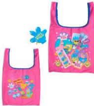
ポーチ付きエコバッグ 2,750円