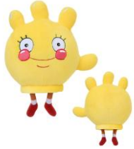
Glovey Glove ぬいぐるみ 2,530 円