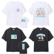
コットン Tシャツ 4種 各4,290円