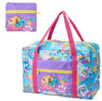
バックブルトート 3,960円