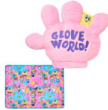
ブランケットインクッション 4,620円