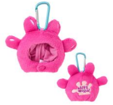
帽子型マスコットキーリング 1,430円