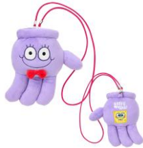
グローブ型ぬいぐるみサコッ シュ 2,530円