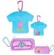
ダイカットポーチ Tシャツ/チ ケット 各1,650円