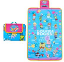
ピクニックマット 2,970円