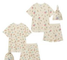
JEMORGAN ルームウェア 3点 セット 2種 各7,480円