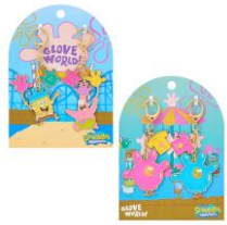
ペアキーリング 2種 各1,650円