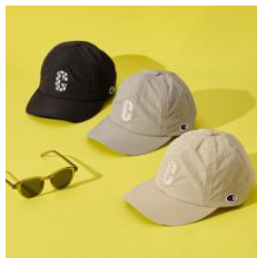
Champion 花口 ゴキャップ 全3種 各4,290円、 EDGE STYLE サングラス ES505-7LGR 4,180円