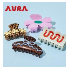
AURA ヘアアクセ サリー 全4種 各 3,300～3,520円