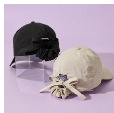
OUTDOOR PRODUCTS シュシュリボン キャップ 全2種 各3,960円