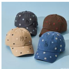
'47 刺しゅうキャップ 全4種 各4,950円