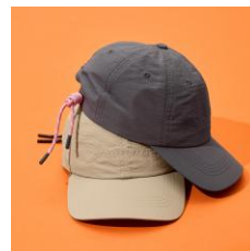
OUTDOOR PRODUCTS コードキャップ 全2種 各3,960円