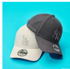
NEW ERA ラインストーンキャップ 全2種 各5,500円