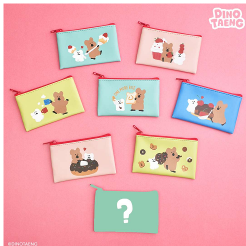
シークレットミニポーチ 各770円(税込)