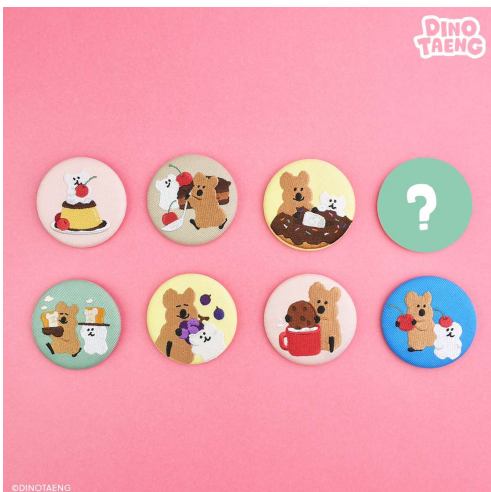
シークレット刺繍缶バッジ 各770円(税込)

それぞれのアイテムには、開けるまでドキドキの「シークレットデザイン(?マーク)」も！バッグにつけたり、お気に入りの小物を入れたり、持っているだけで毎日がちょっとハッピーになるラインアップをお楽しみください。