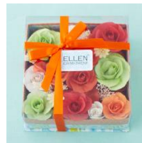
フレグランスフラワーボックス ¥1,575