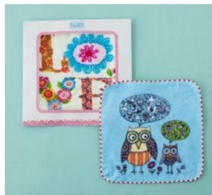
シェニール織ハンカチ ¥1,890 タオルハンカチ ¥840