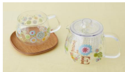
ティータイムセット ¥3,150