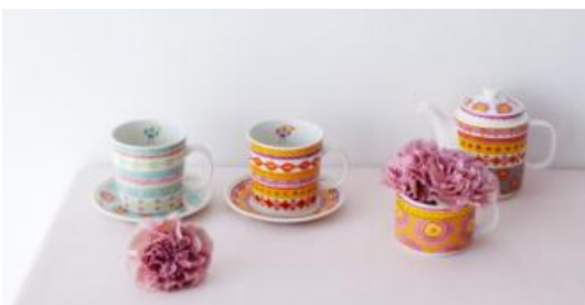
マグ&プレート ¥1,575 ティーフォーワン ¥2,100