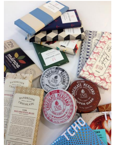
■テイスティングいただける6ブランド MAST BROTHERS CHOCOLATE、TCHO、TAZA、 DANDELION CHOCOLATE、CACAO PRIETO、 manoa Chocolate Hawaii