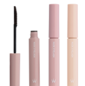
ヌードアイラッシュ 全3色 各1,430円