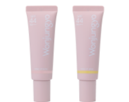
トーンアップベース 全2色 各1,430円