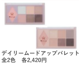
デイリームードアップパレット 全2色 各2,420円