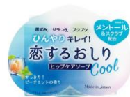
恋するおしり ひんやりク ール 660円