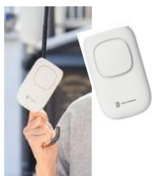
日傘クリップファン 2,728円