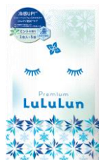
プレミアムルルルン シャー ベットマスク 1,650円