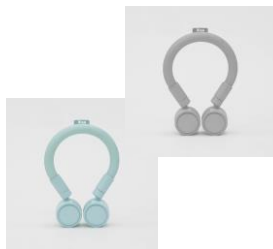
iFAN クールネック 各5,478円 ※一部店舗での販売