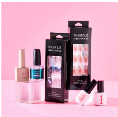
ネイルカテゴリー (ネイルカラー部門、ネイルチップ部門、ネイルケア部門)