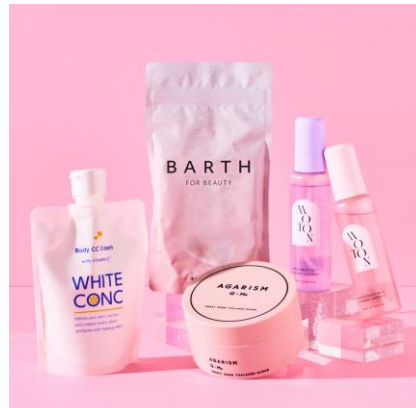
ボディケアカテゴリー (フレグランス部門、バス部門、ボディスペシャルケア部門)