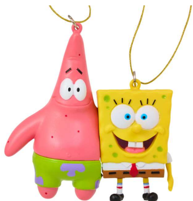
6,000円(税込)以上お買い上げのお客様にプレゼント

スポンジ・ボブ ポップアップストア「Always hungry!」にて、 6,000円(税込)以上お買い上げのお客様に、オーナメントを 3,000円(税込)以上お買い上げのお客様に、リングノートを先着でプレゼント！ ※1会計につき1点プレゼントします。 ※数量限定、なくなり次第終了です。