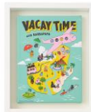
キャンバス額装 203×255mm 4,000円