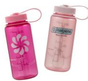
ナルゲン 広口ボトル 0.5L 各1,750円