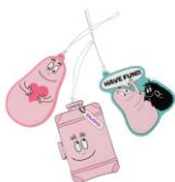
ラゲッジタグ 各1,400円