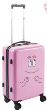
スーツケース 32L 15,000円