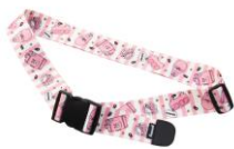
トランクベルト 1,900円