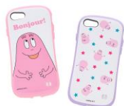
iFace iPhone8/7用ケース 各3,700円