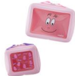
ウィンドウポーチ S 1,200円 M 1,500円