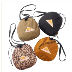
KELTY(ケルティ) 巾着型バッグ(全4色) 各3,520円