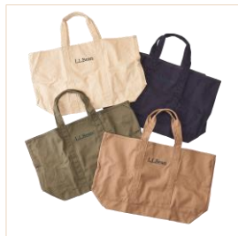
L.L.Bean(エルエルビーン) グローサリー・トート(全4色) 各2,640円