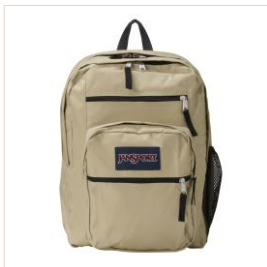
JANSPORT(ジャンSPORT) BIG STUDENT バックパックタン(他にブラック) 9,680円