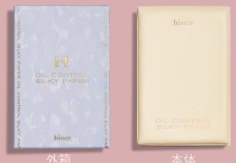
hinceのアイテムを4,000円(税込)以上お買い上げの方に「オイルシルキーペーパー」(非売品)をプレゼント！