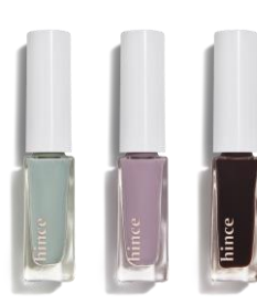
グロウアップネイルカラー 左から U003 アンペール、U007 リバティアー、U008 フレッシュアウト 各1,375円