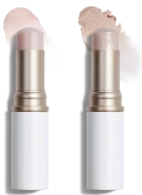
トゥルーディメンションラディアンスパーム 左から TP001 クリア、LT001 ライト 各3,300円