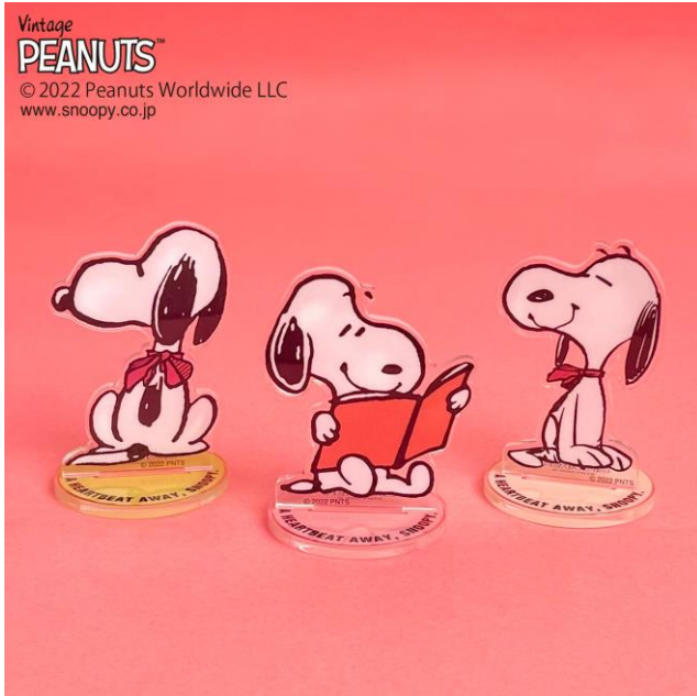
スヌーピー アクリルスタンド(非売品) 9月30日(金)より全国のPLAZA・MINIPLAで、ピーナッツのアイテムを含む3,000円(税込)以上お買い上げのPLAZA PASS 本会員の方にプレゼント。

株式会社スタイリングライフ・ホールディングス プラザスタイル カンパニー(東京都新宿区)は、2022年9月30日(金)から10月27日(木)まで、全国のPLAZA・MINIPLAにて、人気キャラクター『PEANUTS(ピーナッツ)』のPLAZAオリジナルデザインアイテムを展開するプロモーション「A HEARTBEAT AWAY, SNOOPY(アハートビート アウェイ スヌーピー)」を開催。プロモーションスタートと同時に、限定ノベルティ「スヌーピー アクリルスタンド」(非売品)のプレゼントキャンペーンを開始します。