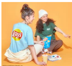
左から Lay's/Tシャツ(ブルー、グリーン)、Fantastic Beasts/Tシャツ、Harry Potter/Tシャツ、The BIG BANG THEORY/Tシャツ、Friends/Tシャツ(ライトパープル) 各3,960円

●プロモーション特設ページ： https://www.plazastyle.com/tee_2023/?press=tee0407