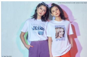
左から TAKE THAT/Tシャツ、BRITNEY SPEARS/Tシャツ 各3,960円、DOJA CAT/Tシャツ、2PAC/Tシャツ 各4,620円、JAMIROQUAI/Tシャツ 3,960円