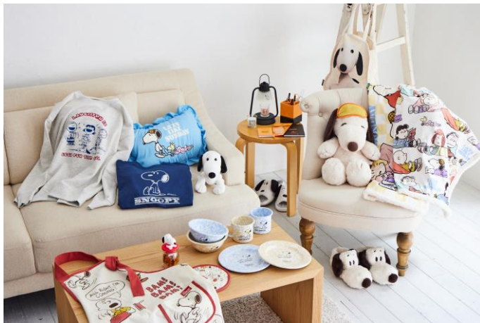
stay in kind of SUNDAY, SNOOPY 商品ラインアップ(イメージ)

株式会社スタイリングライフ・ホールディングス プラザスタイル カンパニー(東京都新宿区)は、2023年10月6日(金)から10月26日(木)まで、全国のPLAZA・MINiPLAにて、人気キャラクター『PEANUTS(ピーナッツ)』のPLAZAオリジナルデザインアイテムを展開するプロモーション「stay in kind of SUNDAY, SNOOPY(ステイ イン カインド オブ サンデー スヌーピー)」を開催。店舗での発売に先駆け、9月27日(水)AM10:00より、PLAZAのECサイト「PLAZA オンラインストア」にて、プロモーションアイテムの先行予約受付と、PLAZA オンラインストア限定ノベルティ「カトラリーセット(非売品)」のプレゼントキャンペーンを同時スタートします。