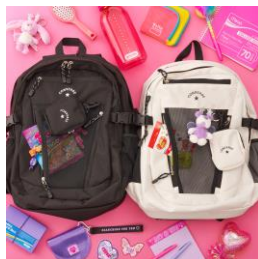
CONVERSE バックパック 28L (ブラック、オートミール) 9,790円