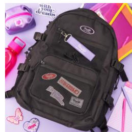
Daylife バックパック 12,100円