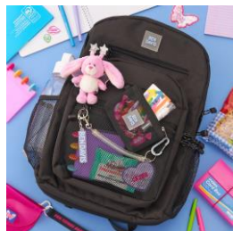
BEN DAVIS MESH XL-PACK バックパック ブルー 9,900円