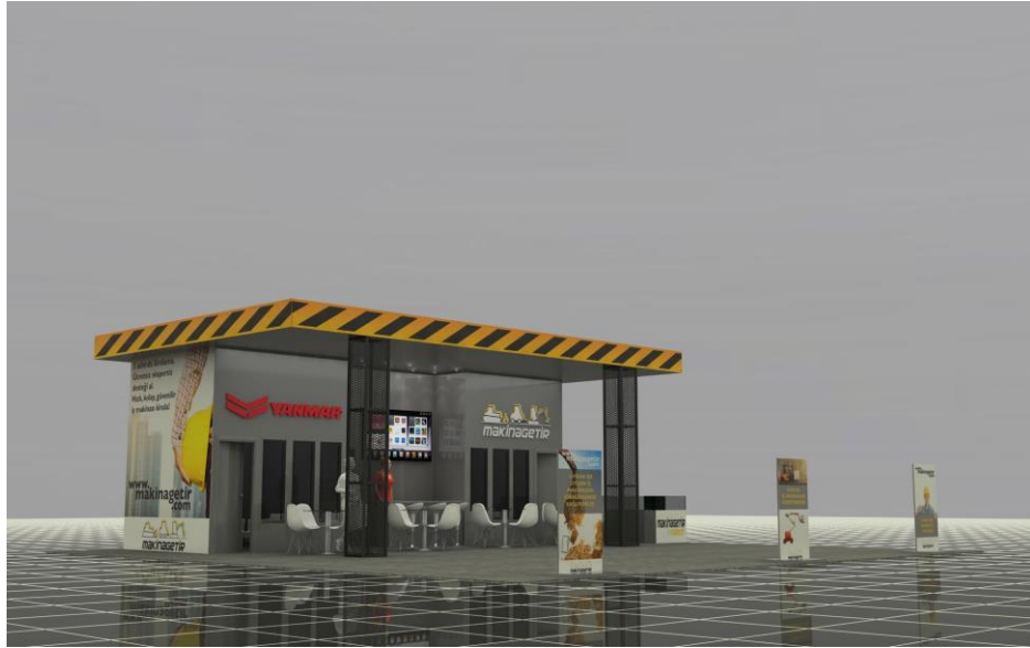
<「MARBLE IZMIR FAIR」ヤンマーブースイメージ>

※ トルコ、イズミール・エーゲエリアにおいて。2019年3月現在。ヤンマー調べ。