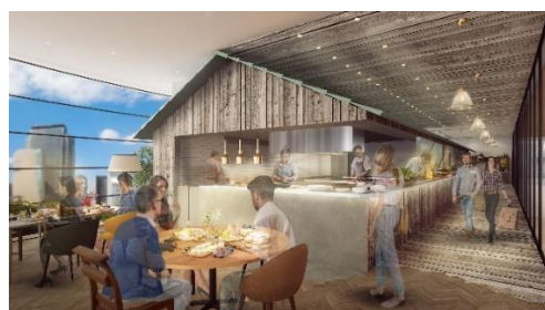
<左:「ヤンマー米ギャラリー」イメージ、右:「ASTERISCO」店内イメージ>