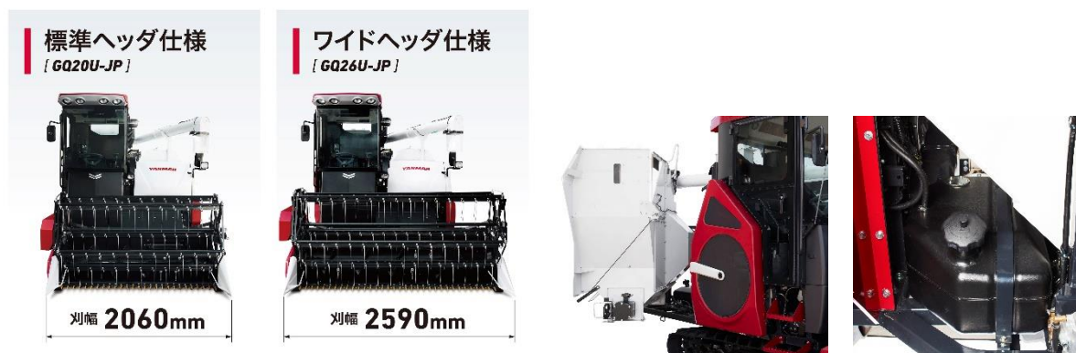
<刈幅が選択できる 2 種類のヘッダ>

作業環境や圃場規模などに合わせ、2.0m と、2.6m の 2 種類のヘッダから選択が可能です。これまで条合わせが難しかったところも、2.6m のワイドヘッダなら高能率作業が可能です。また、1550L のグレンタンクにより、連続して刈取りできる面積が広く、作業能率が向上します。さらに、115L の燃料タンクを満タンにすることで、一日の作業を給油無しで行うことが可能です。