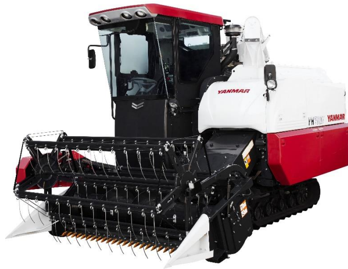
< 普通型コンバイン「YH700M」 >