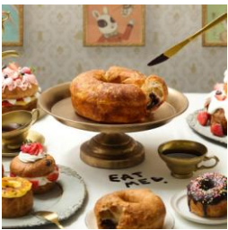
「マジカルチョコリング」