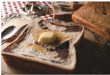
「あんこはもうたくさん! 太っちょ王様のあん食パン」