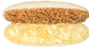
鶏そぼろたまご 税込 360 円