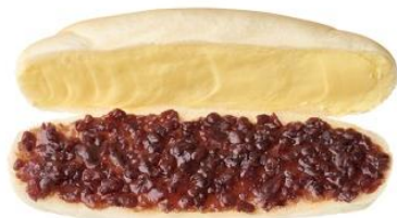
小倉マーガリン 税込 250 円

千葉初出店となるイクスピアリ店では、コメダ珈琲店発祥の名古屋定番の小倉あんを挟んだコッペパンに、生姜の風味がきいた鶏そぼろとふわふわのたまごをはさんだコッペパンなど、約20種類以上の味をお楽しみいただけます。コメダの美味しいパンづくりへのこだわりを詰め込んだ、どこか懐かしいコッペパンを味わってみてはいかがでしょうか。