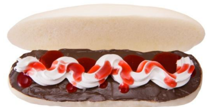
ラズベリーチョコホイップ 税込 290 円(期間限定)