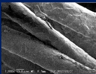
ニューサンライズウールの表面