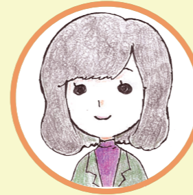
きみしませんせい

子どもたちは日々沢山の学びに触れながら成長しており、その中には『失敗』に直面する機会が必ずどこかで訪れます。失敗体験から子どもが「勉強きらい！」になるか「なぜだろう？もう1回チャレンジしたい！」になるかは、周りでサポートする大人の対応で大きく変化します。あるふあるふあではお子さまのタイプをしっかりと把握し分析した講師が楽しい学びを提供するので、多くの気づきを得ながら論理的思考を自然と身につけていきます。「できた！」を生み出す強いねっこ(土台)作りでお子さまの未来をサポートします。