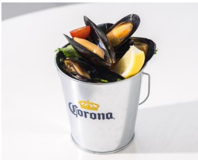
「ムール貝のコロナビール蒸し」