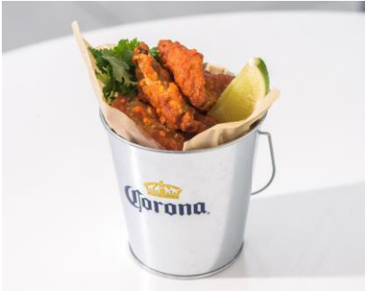
「メキシカンバッファローチキン」

4年に一度のオリンピックという特別な時間を、コロナビールを隠し味に使ったオリジナルフードとともに楽しみください。