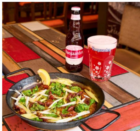
ホタルイカと春野菜のパエリア (R)