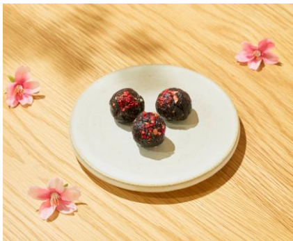
【エネルギー桜菓団】

※期間中先着100名様に限り、クーポン提示でアルコールプラン通常2,200円(税込)/60分のところ、特別価格の2,000円(税込)/60分でご利用いただけます。詳しくはキャンペーン特設サイトをご確認ください。(代官山 蔦屋書店 SHARE LOUNGEのみご利用可能です。クーポンご利用はお一人様1回限り。60分以降は、通常料金となります。先着100名様に達し次第終了となります。)