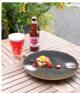
代官山チーズケーキ