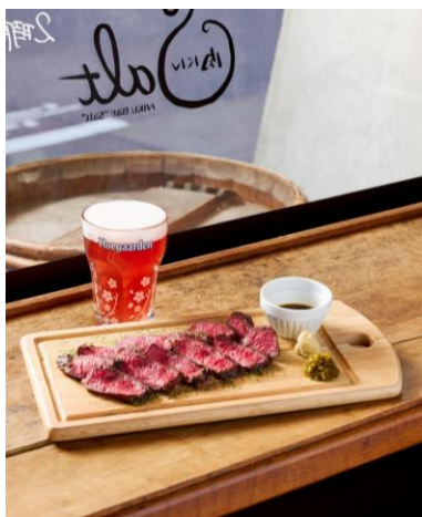
Salt Beef Plate（“生”ザブドンのステーキ） M/200g