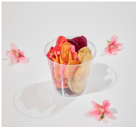
お花見チップス（野菜チップス） 500 円