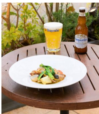
真鯛のアクアパッツア