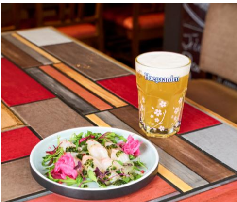
鮮魚のカルパッチョ