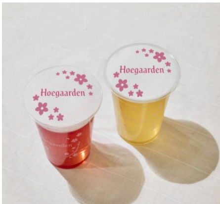
ヒューガルデン ロゼ・ホワイトを使用した 特別桜ビアアート 各 900 円