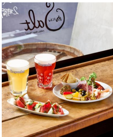
手前左／生ブッファラとトマトのカプレーゼ 手前右／本日の前菜盛り合わせ（2 人前から）