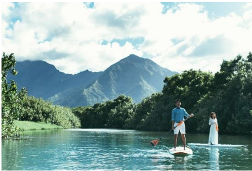
ハワイ(カウアイ島)