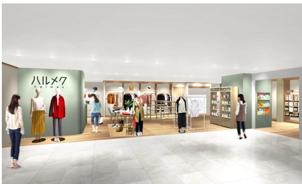
※写真は店舗イメージ

ハルメク おみせでは、雑誌「ハルメク」と一緒にお届けする通販カタログ「ハルメク おしゃれ」「ハルメク 健康と暮らし」で販売しています。50代以上の女性のために開発したオリジナルのファッションアイテムやコスメ、体や生活のお悩みに応える生活用品、インナーなどさまざまな商品を購入いただけます。