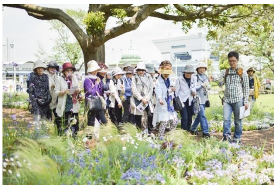
定番人気イベントの「草花散歩」

当社は、雑誌以外の事業にも力を入れています。企画から運営まですべて自社スタッフが行うオリジナルイベントを、年間約200回開催しています。最近話題の「きくち体操」等、雑誌「ハルメク」で人気連載を持つ方を講師に招いた講座も頻繁に開催しています。