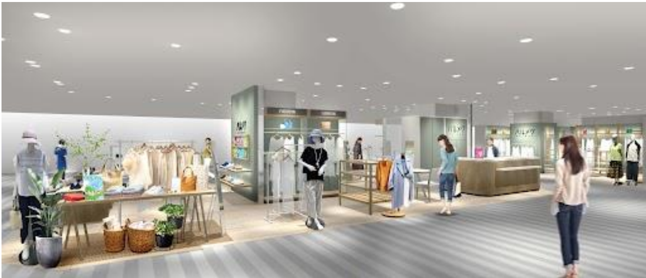
※写真は店舗イメージ

そごう千葉店は、雑誌「ハルメク」と一緒にお届けする通販カタログ「ハルメク おしゃれ」「ハルメク 健康と暮らし」で販売している商品を扱うハルメク おみせ。50代以上の女性のために開発したオリジナルのファッションアイテムやコスメ、下着などさまざまな商品を購入いただけます。