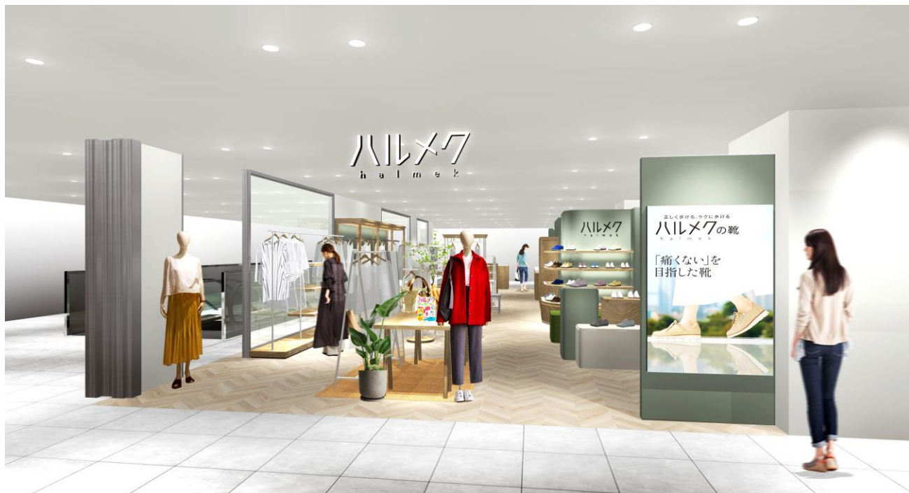
※写真は店舗イメージ

雑誌「ハルメク」と一緒にお届けする通販カタログ「ハルメク おしゃれ」「ハルメク 健康と暮らし」で販売している商品を扱うハルメク おみせ。50代以上の女性のために開発したオリジナルのファッションアイテムやコスメ、下着などさまざまな商品を購入いただけます。