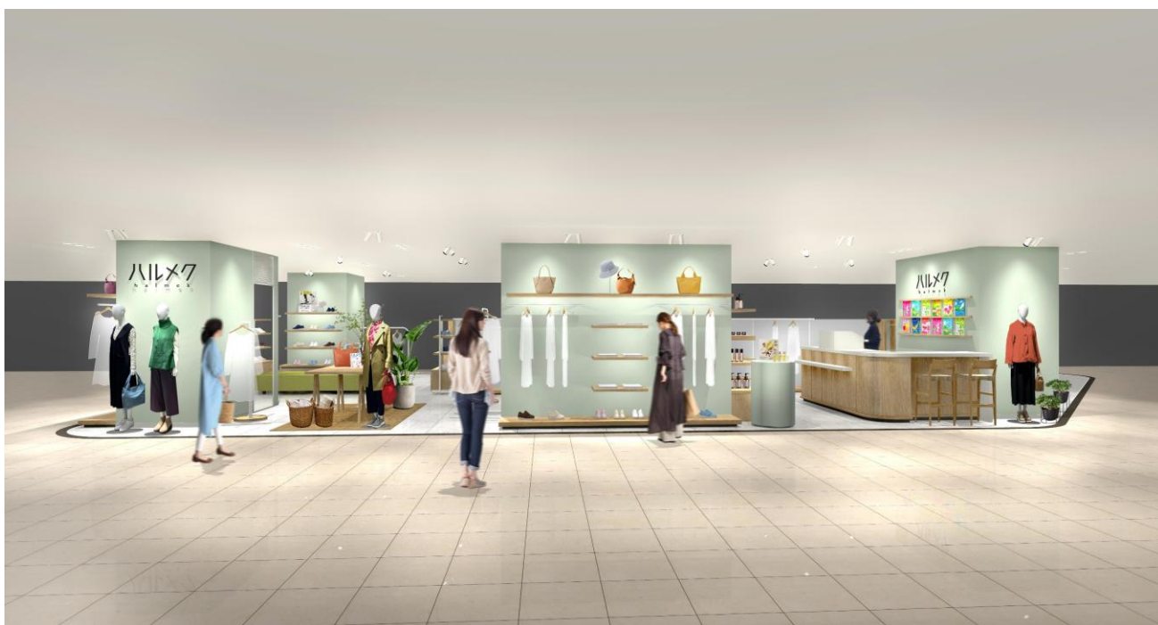
※写真は店舗イメージ

雑誌「ハルメク」と一緒にお届けする通販カタログ「ハルメク おしゃれ」「ハルメク 健康と暮らし」で販売している商品を扱うハルメク おみせ。50 代以上の女性のために開発したオリジナルのファッションアイテムやコスメ、下着などさまざまな商品を購入いただけます。