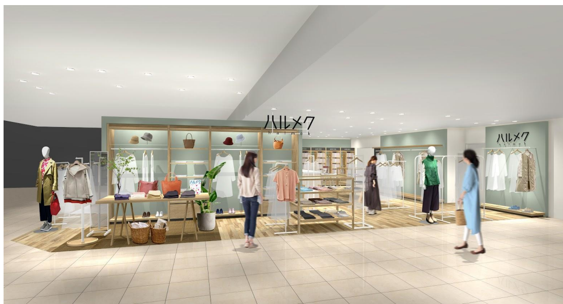
※写真は店舗イメージ

小田急百貨店 町田店では、これまで1階・婦人靴売場で「ハルメクの靴」を販売しておりましたが、お客様から高いご支持をいただき、このたび4階に「ハルメク おみせ」をオープンすることになりました。雑誌「ハルメク」と一緒にお届けする通販カタログ「ハルメク おしゃれ」「ハルメク 健康と暮らし」で販売している商品を扱うハルメク おみせ。50代以上の女性のために開発したオリジナルのファッションアイテムやコスメ、インナーなどさまざまな商品を購入いただけます。