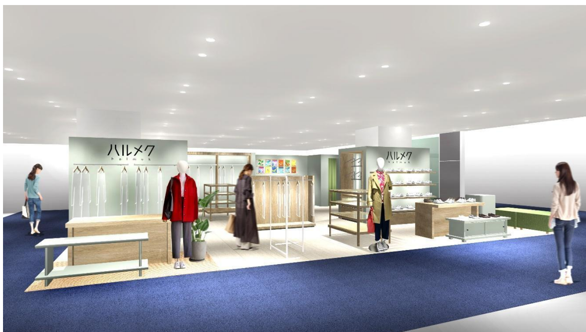
写真は店舗イメージ

雑誌「ハルメク」と一緒にお届けする通販カタログ「ハルメク おしゃれ」「ハルメク 健康と暮らし」で販売している商品を扱うハルメク おみせ。50 代以上の女性のために開発したオリジナルのファッションアイテムやコスメ、体や生活のお悩みに応える生活用品、下着などさまざまな商品を購入いただけます。