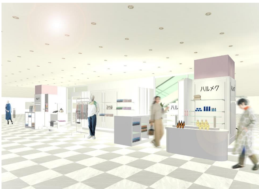
※写真は店舗イメージ

「ハルメク おみせ」では、雑誌「ハルメク」と一緒にお届けする通販カタログ「ハルメク おしゃれ」「ハルメク 健康と暮らし」で販売している、50代以上の女性のために開発したオリジナルのファッションアイテムやコスメ、体や生活のお悩みに応える生活用品、下着など様々な商品をお試し、購入いただけます。