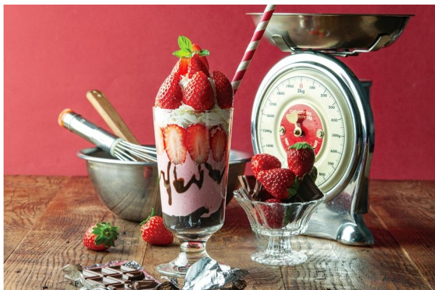
「バレンタインスムージーボンボン」 価格 1,300円（税抜） テイクアウトもご利用いただけます。