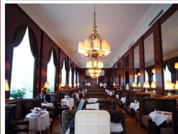
ウィーンで約150年の歴史を誇る CAFÉ LANDTMANN.

2月1日（土）から2月14日（金）の期間限定で、「バレンタインスムージーボンボン」が新登場。ラズベリーとホワイトチョコのスムージーに、ブラックカカオクリームがアクセントになった大人味のスムージー。たっぷりのいちごとホイップクリームが、バレンタイン気分をさらに盛り上げます。自分へのご褒美にもおすすめのスペシャルなスムージーです。