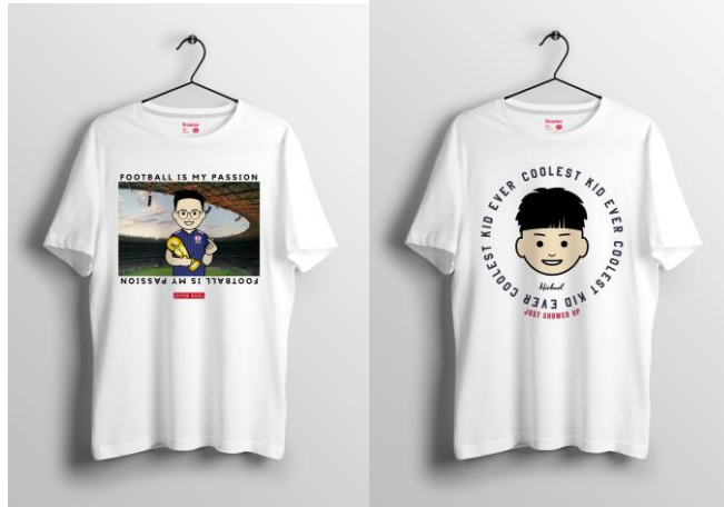
画像リンク：アバターTシャツ