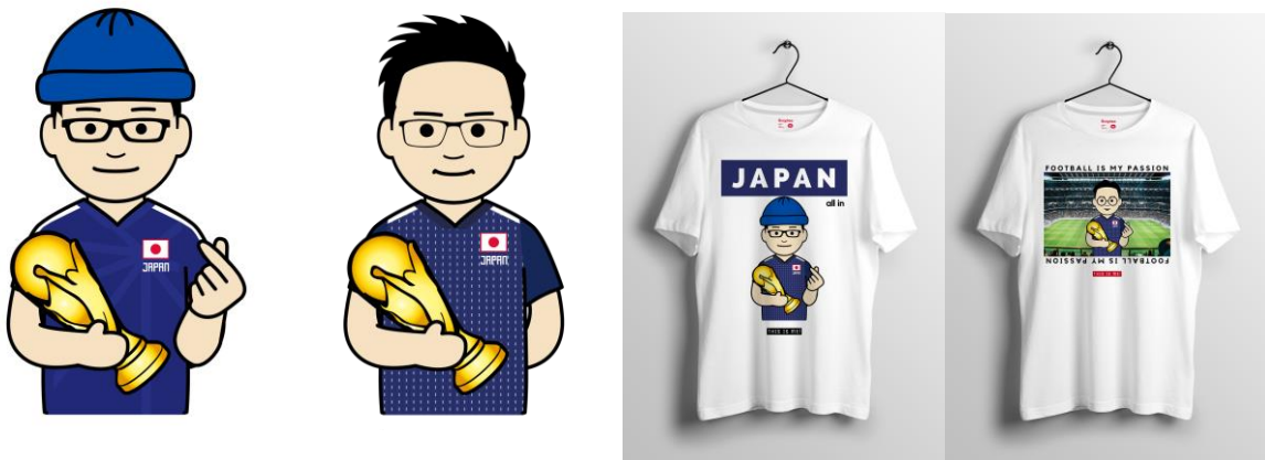
画像リンク：サッカー関連パーツ

いよいよ本格的なワールドカップシーズンが幕開けます！Snaptee Kioskは、ワールドカップ応援企画として、サッカー関連パーツが次々に導入。作成したアバターを好きなチームウェアと組み合わせられる上に、レオ・メッシ、クリスティアーノ・ロナウドなど、有名なサッカー選手のチビ画像まで選ぶことができるようになっています。ワールドカップにちなんだ要素を加えたアバターTシャツで、ワールドカップの世界感を満喫しましょう！