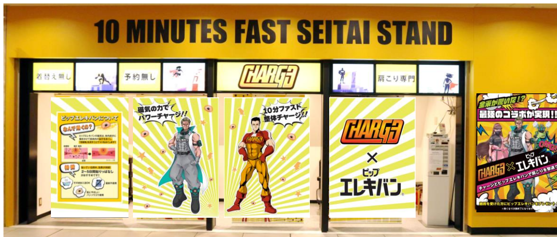
※画像はイメージ図です。

CHARGE（ヤエチカ店）のロールスクリーンを「ピップエレキバン」のコラボバージョンにCHANGEしました！店舗のロールスクリーンのデザインまでコラボするのは、CHARGEにとっても初めての試みです。「ピップエレキバン」とCHARGEが力を合わせて、毎日頑張っている皆様のコリを解消し、パワーチャージできるように全力でケアします。