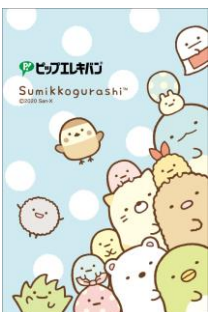
ミニポーチデザイン