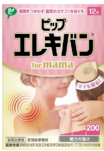
ピップエレキバン for mama 販売名 ピップエレキバンMAX200

また、ピップエレキバンを持ち歩ける、便利な専用ミニポーチ付き。化粧ポーチやバッグにも入る使いやすいサイズです。お出かけ中、コリが気になるときいつでも気軽にケアできます。また、コリにお悩みのママ友へのプレゼントにもおすすめです。ぜひ様々なシーンでお使いください。