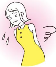
生理中やおりものべたつきによる不快感に