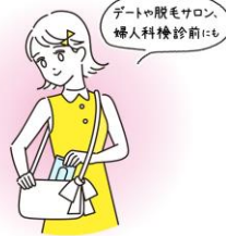
外出先でのエチケットケアに