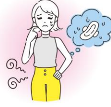
生理中のムレが気になるときに