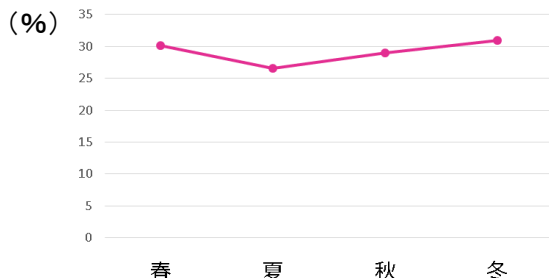
<図2> 季節別 重ダル脚が気になる方の割合