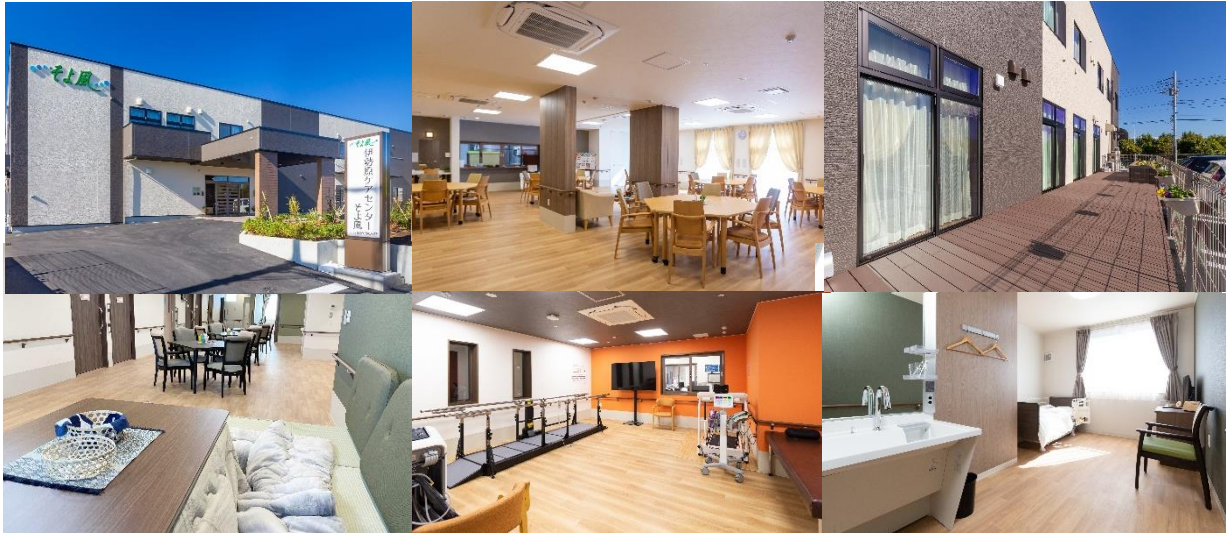
12月開設「伊勢原ケアセンターそよ風」(左上)施設外観、(中央上)オープンキッチンの食堂兼機能訓練室、(右上)1階テラス (左下)ショートステイ共同フロア_阿夫利、(中央下)ショートステイ機能訓練室、(右下)ショートステイ居室例

ショートステイ https://www.sykz.co.jp/shisetsu-zaitaku/144743