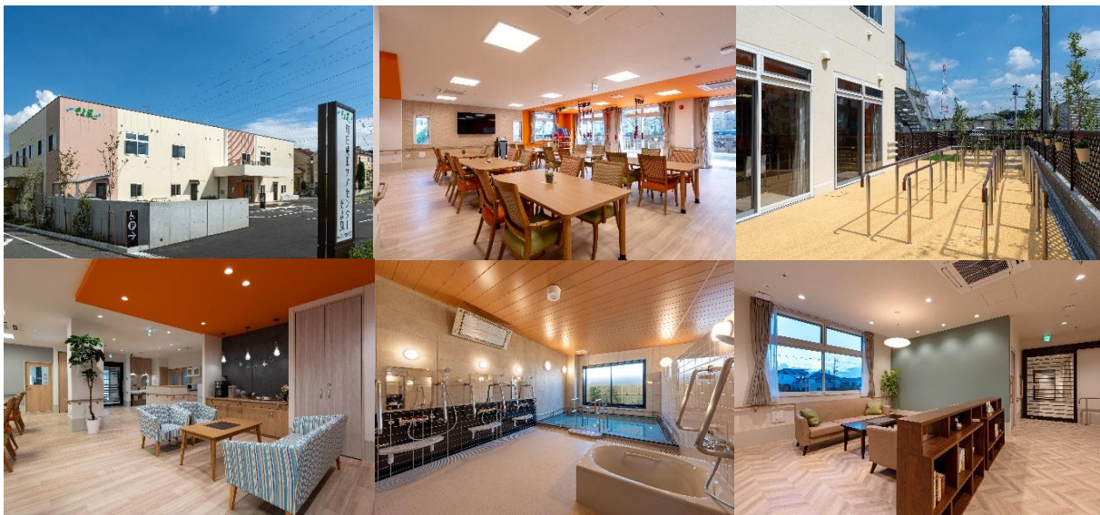
11月開設「町田成瀬ケアセンターそよ風」(左上)施設外観、(中央上)鮮やかなオレンジ色を配した食堂、(右上)歩行訓練スペース (左下)ドリンクコーナー、(中央下)1階浴室、(右)ショートステイ 共同フロア

ショートステイ https://www.sykz.co.jp/shisetsu-zaitaku/134763