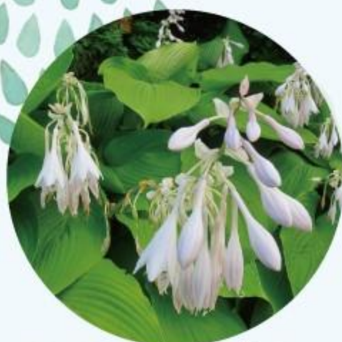
オオバギボウシ 6月～7月