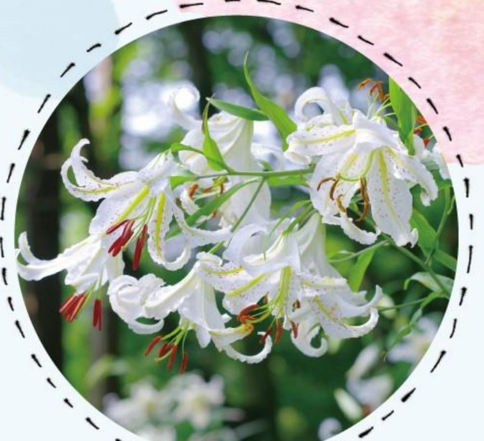
ヤマユリ 7月中旬～下旬