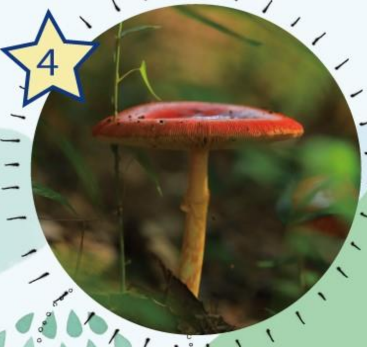
タマゴタケ などキノコ 初夏～秋