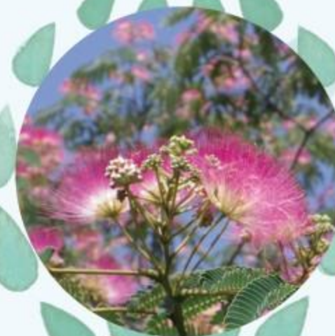
ネムノキ 6月中旬～7月上旬