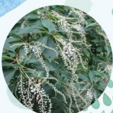
リョウブ 6月中旬～7月