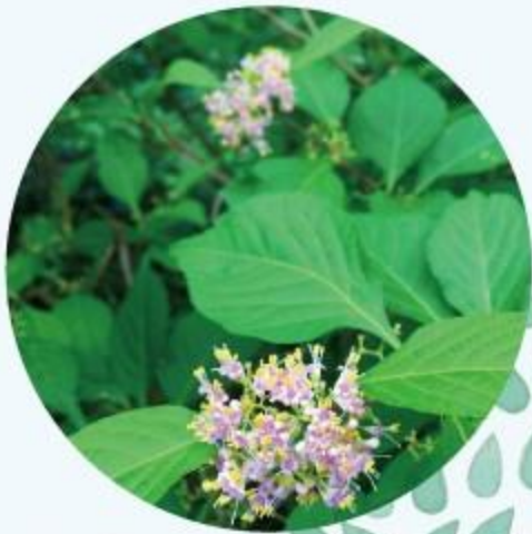
ムラサキシキブ 6月～7月