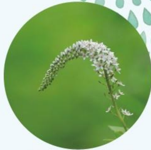
オカトラノオ 6月中旬～7月