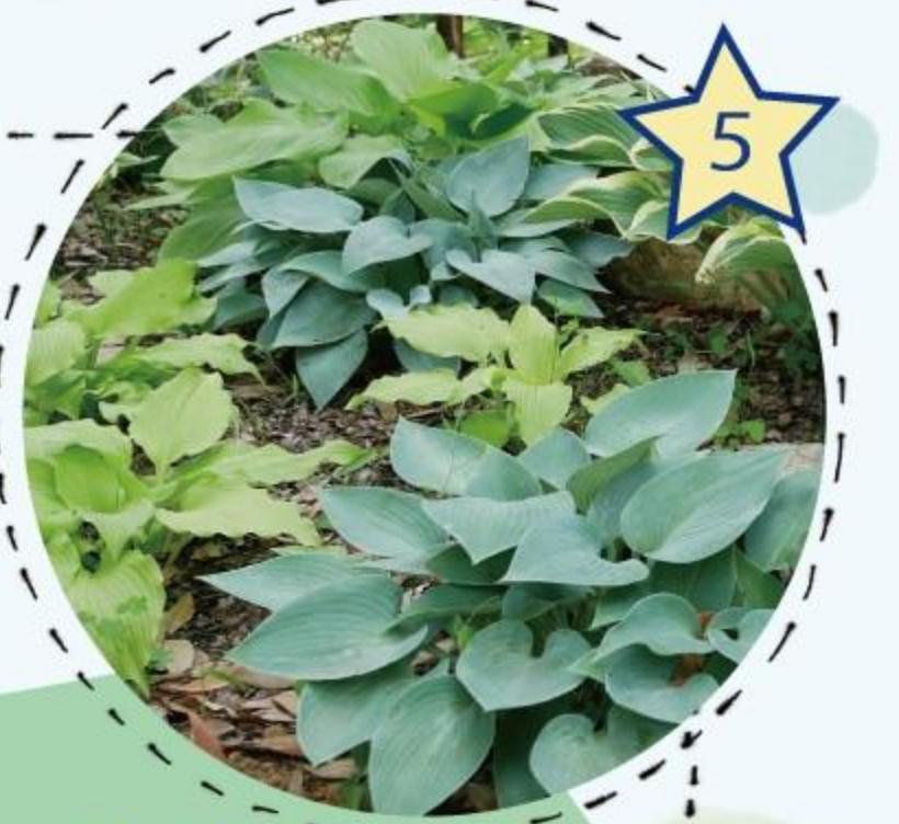
ギボウシガーデン

ホスタオブザイヤー受賞品種など 人気のある種を含め、さまざまな ギボウシを植栽しています。 シルバーの葉や細い葉など、 好きな形のギボウシを見つけて みるのも楽しいですよ!!