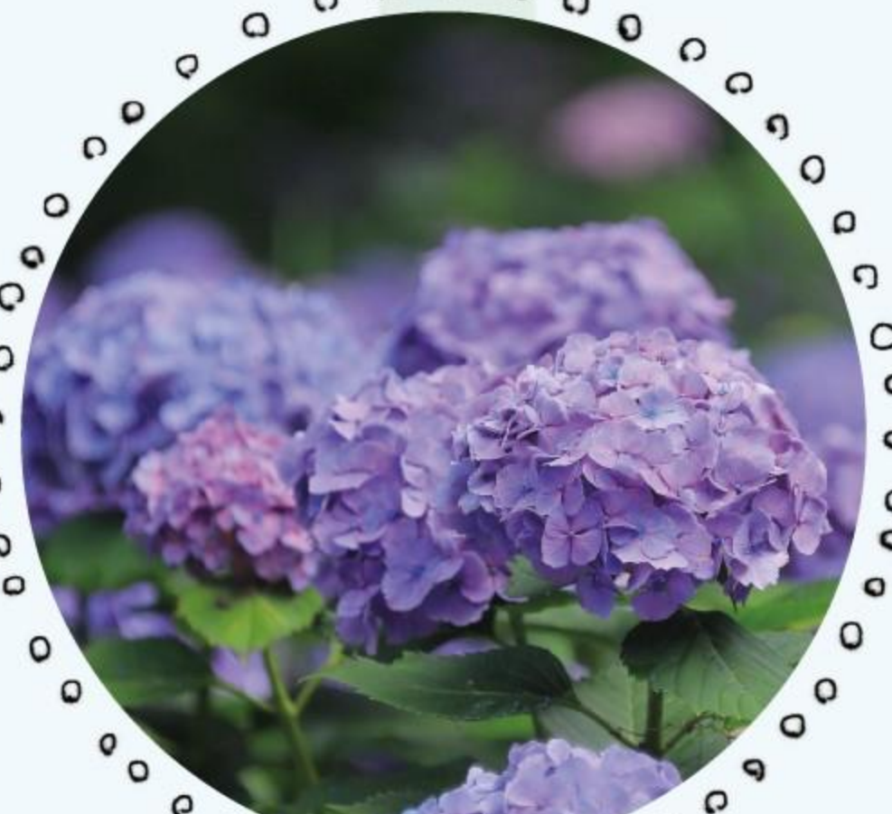
アジサイ 6月中旬～7月上旬